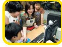
コンピューター工房 コンピューターを使ってロボットを動かしたりアニメを作ったりしよう。大型タッチスクリーンもあるよ。

「ものをつくる喜び」を知るプログラムがいろいろ。クリエイティブの翼を広げるスペースが並んだフロアです。