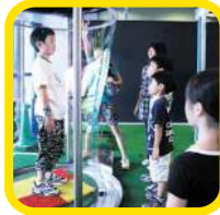
科学 人が入れるしゃぼん玉 大きな大きなしゃぼん玉の中に大人も子どももすっぴり不思議体験の大人気コーナーだよ。

思わずやってみたくなる楽しい展示やワークショップ。 科学や文化を遊びながら学べるコーナーが集まったフロアです。