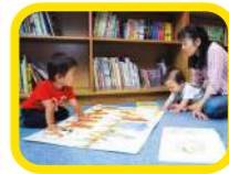
ライブラリー 遊び疲れたら、ここでちょっと休み。靴をぬいで、くつろぎながら読書が楽しめるよ。