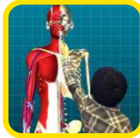
体 キッズラボ BODY 3D人体解剖ガイドです。人体模型をぐるぐる回して筋肉と骨格を詳しくリサーチ！