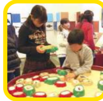
自然 だれのかけら？ 虫のかけらは脚や触角。かけらをよく見て、なんの虫かあててみよう。魚のかけらもあるよ。