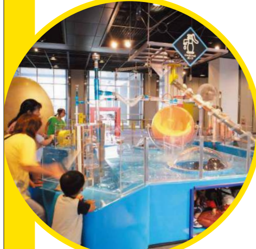
科学 じゃぶじゃぶポンプ ポンプを使って真ん中のタルに水をためよう！さあ、いっぱいになったら、何が起るかな？