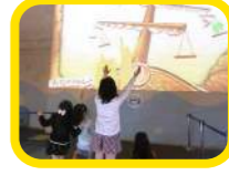
デジタル体感ひろば アクア デジタルデバイスを使った次世代の「遊び」と「学び」が体験できるよ。