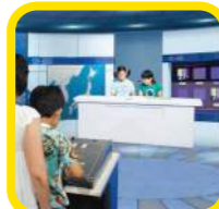
文化 わいわいスタジオ ニュース番組やクロマキー合成など映像のいろいろな体験ができるよ。さあ、本番スタート！