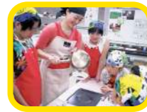
パーティーキッチン 身近な食べ物じっくりと見てふれて・食べてみる。いろんな発見ができるよ。