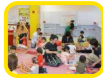
ビーカーブ 乳幼児のためのプレイルーム。授乳室完備だから、ママも安心。

不思議がいっぱいの「こどもの街」を中心に身近な生活体験をクローズアップしながら遊べるフロアです。