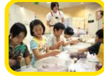
創作工房 創作活動を通して、日常が楽しくなるような体験をしよう。