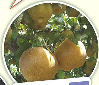
なし狩り 8月中旬～10月上旬 食べ放題