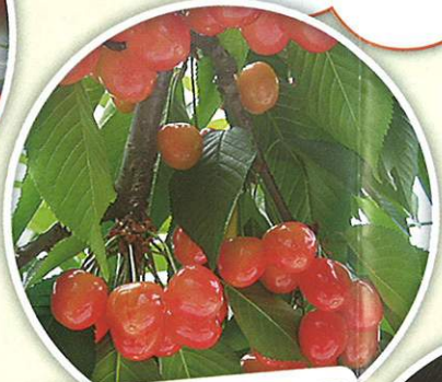
さくらんぼ狩り 6月上旬～6月下旬 30分間 食べ放題