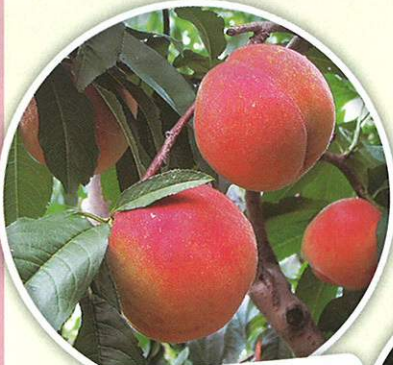
桃狩り 7月上旬～8月上旬 食べ放題