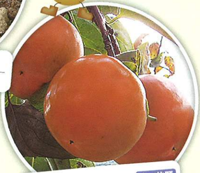
柿狩り 11月上旬～11月下旬 食べ放題 お土産付