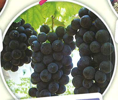
ぶどう狩り 8月上旬～10月上旬 食べ放題