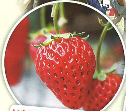
いちご狩り 1月上旬～5月下旬 30分間 食べ放題