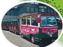
園内周回バス「そらち姫の馬車」 広い園内もらくらく移動できます。