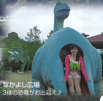
なかよし広場 3体の恐竜がお出迎え♪

アスレチックコース 山中に作られた1.2kmのコースは、自然の起伏を利用した29ポイントの木製遊具とドレッキングの感覚も味わえ、ゴール時の達成感100%! ※安全に注意してご利用ください。