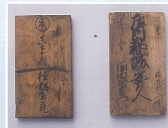
しゅうもんてふだ 宗門手札

明治4年日向国に美々津県と都城県という二つの県が誕生しました。都城県は、大淀川以南の日向国と大隅国の六郡(始羅・肝属・曾於・大隅・菱刈・桑原郡)を県域としました。県庁は、現在の市役所庁舎付近に置られました。