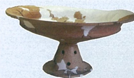
弥生時代の高坏 (今房遺跡)