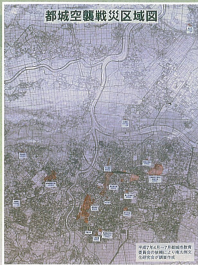
都城空襲戦災区域図