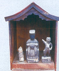
旧唐人町の媽姐像