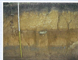
都城盆地の火山灰層

発掘調査による出土品、発掘現場から実際に剥ぎ取った、都城盆地で見られる火山灰層の転写、明治維新から西南戦争などの資料、各時代を分かりやすく解説した写真パネル・模型等によって、縄文時代早期から近現代にいたるまでの都城の歴史を紹介しています。