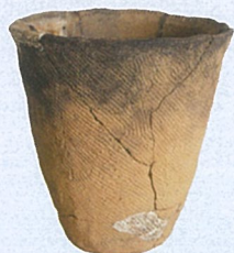
五十市式縄文土器